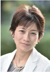
もちづき いそこ 望月衣塑子さん